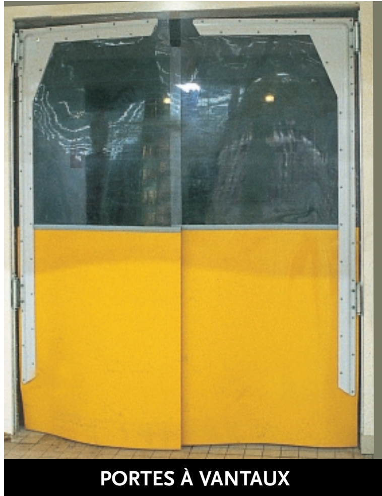
PORTES À VANTAUX