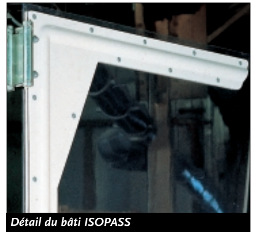
Détail du bâti ISOPASS

La porte à vantaux ISOPASS est une solution rapide et économique pour améliorer l'isolation dans vos locaux.