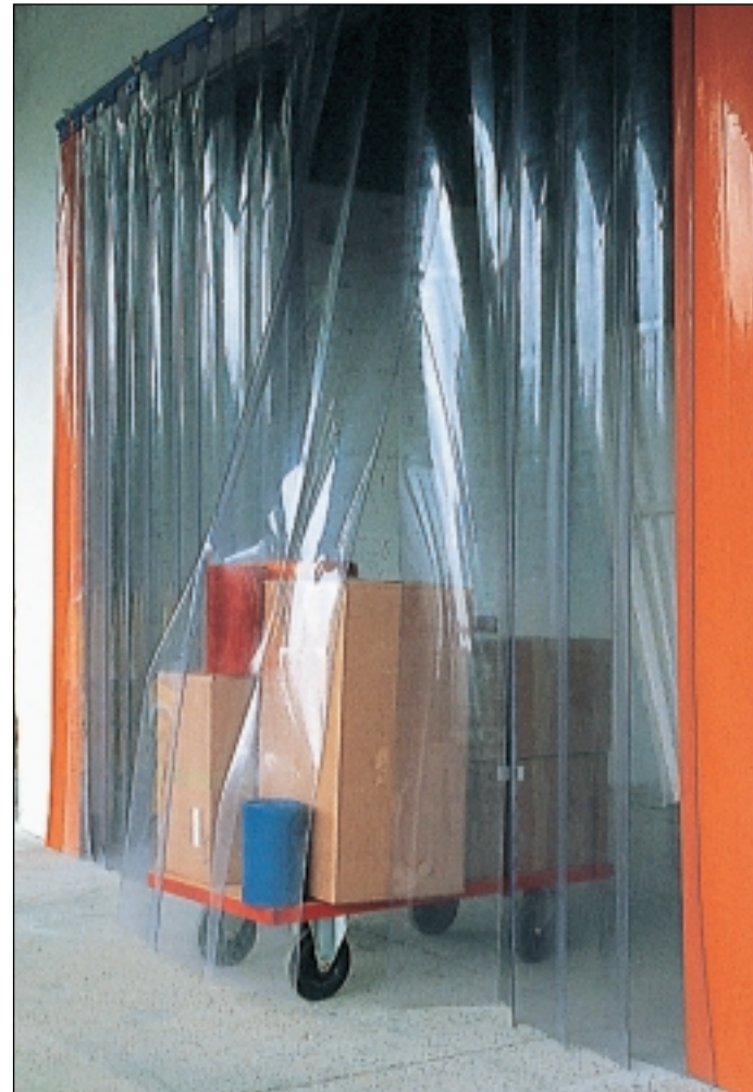
PORTES À LANIÈRES