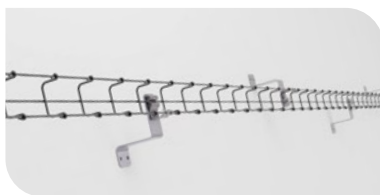
Kit de pose Chemin de câble fil