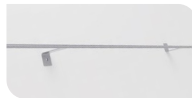
Kit de pose Fil inox