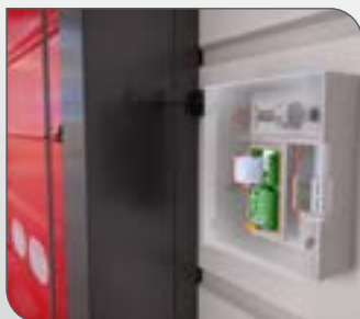
Armoire électronique Maviflex en IP65, avec afficheur LCD