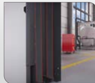
Coulisses souples tendues dans les montants permettant d'amortir les chocs et le bruit