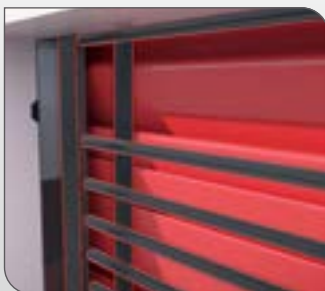
Système à empilage pouvant aller jusqu'à une largeur 14.000mm