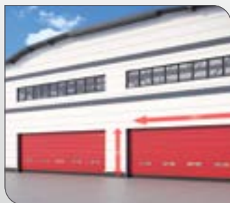
Très grandes dimensions