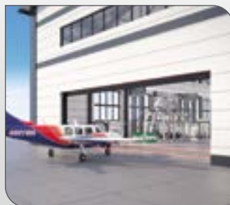
Système SafeCONTROL détection 4 cellules