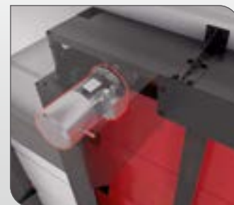
2 moteurs en façade mono-vitesse et frein inox IP55